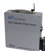
無線小型X線検査装置