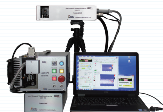
レーザー超音波可視化装置