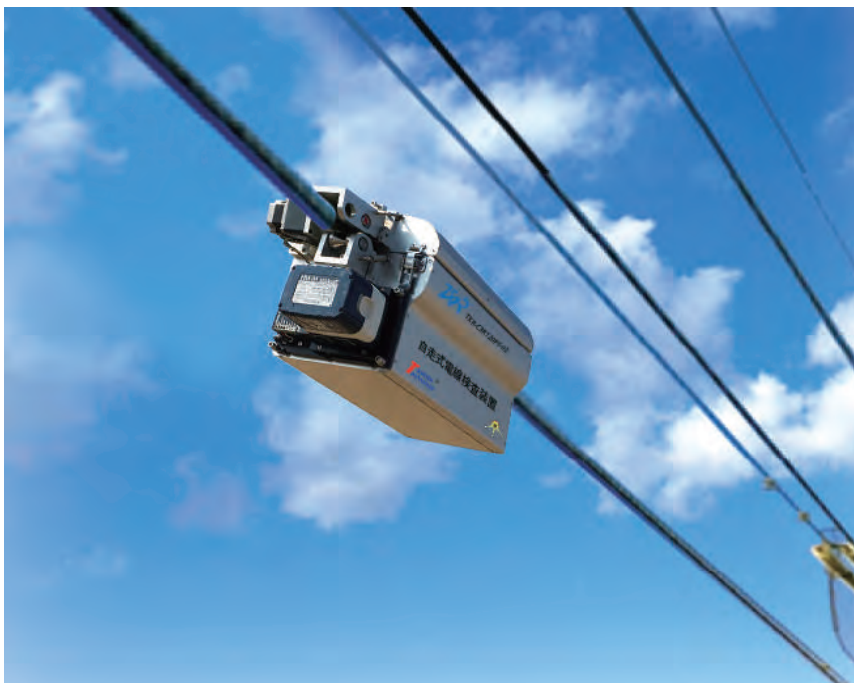
自走式X射线现场检测

重量：26.7kg 尺寸：350×273×275mm 管电压：80~120kV 管电流：2mA（最大） 检测速度：50~60mm/秒 电线尺寸：Φ10~Φ30mm