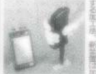
新装置の採用により、短時間で正確に加工... 検査装置を投入

「北東部・東和野」 は、海外強化はこれに 近づく。ゴルフを業し ては、海外強化はこれに 近づく。ゴルフを業し