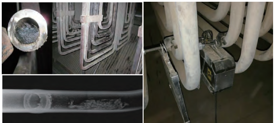
发电厂设备配管检测案例