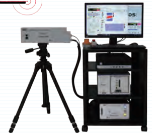
レーザー超音波可視化検査装置