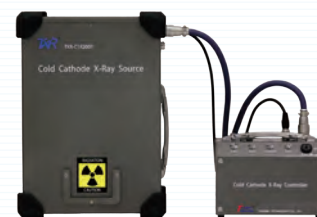
高出力冷陰極小型X線源